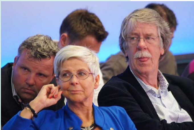
Aandachtig publiek. Kent u ze?