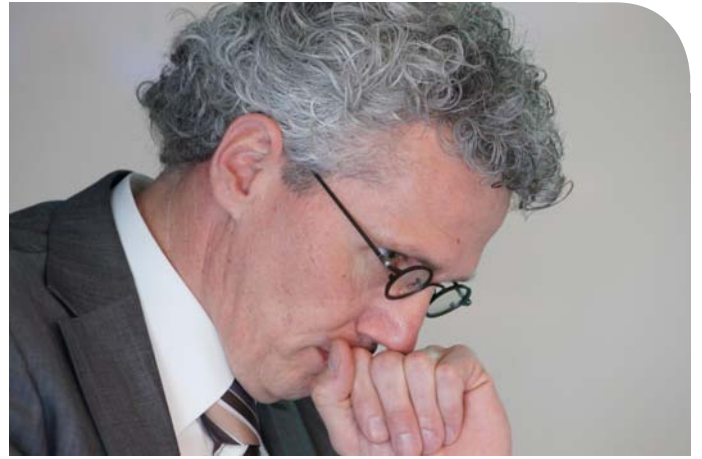
Erik Roelofsen voerde de regie