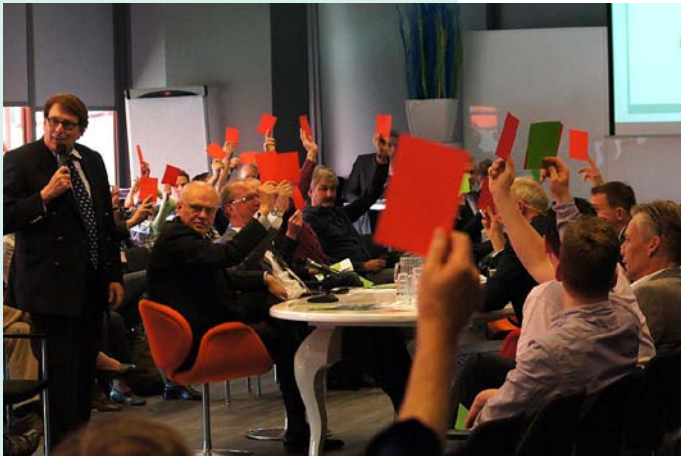
Er werd volop gestemd