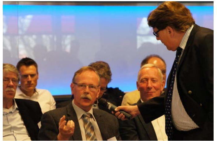
Victor ontlokte reacties